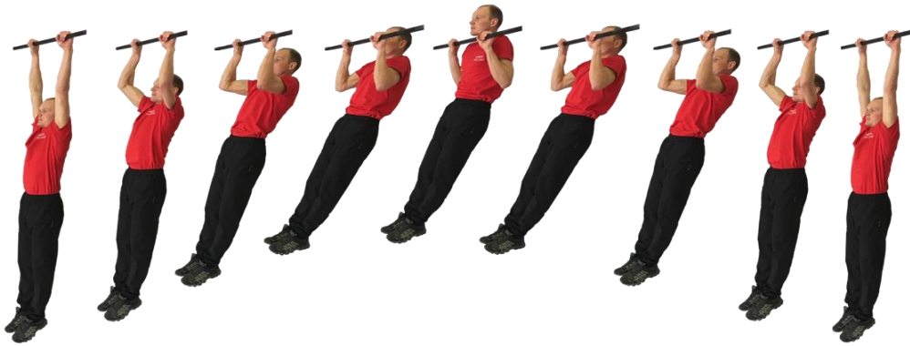
Рис. 1. Подтягивание на перекладине