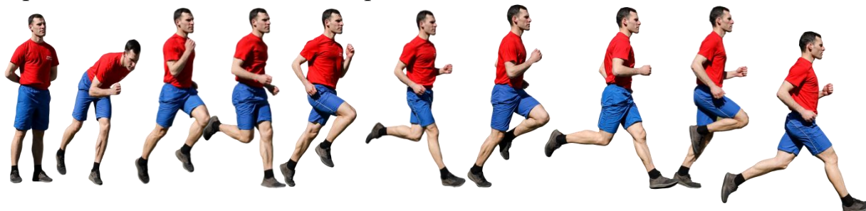
Рис. 7. Бег на 1 км, бег на 3 км.

Старт и финиш, как правило, оборудуются в одном месте. При выполнении упражнений на беговой дорожке стадиона старт и финиш производится в соответствии с разметкой стадиона.